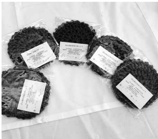
紫色のコースター（がん検診の啓発メッセージ入り）

していただきました。 27 年度も参加を予定しています。多くの会員さんの参加をお待ちしています。