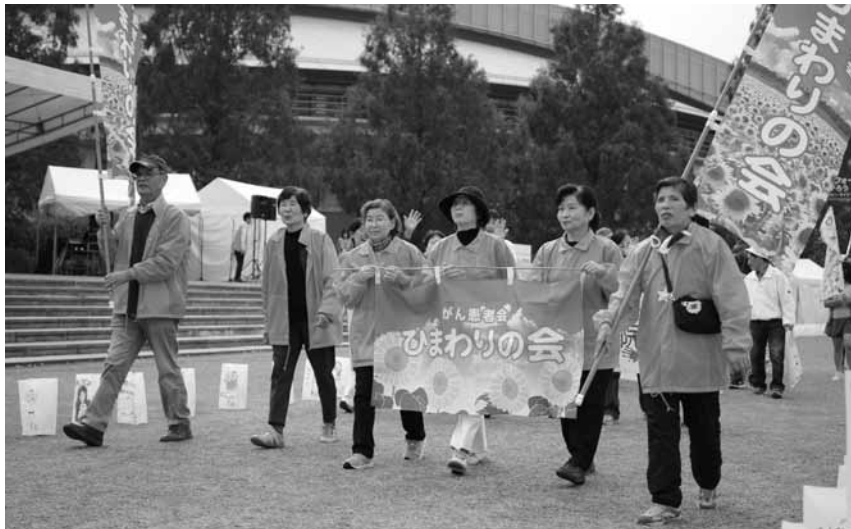
おそろいのジャンパーで元気にスタート！

今年も、会員さんが力を合わせて紫色の毛糸でコースターを編み、200 個ほど寄付し、「チャリティーくじコーナー」の景品と