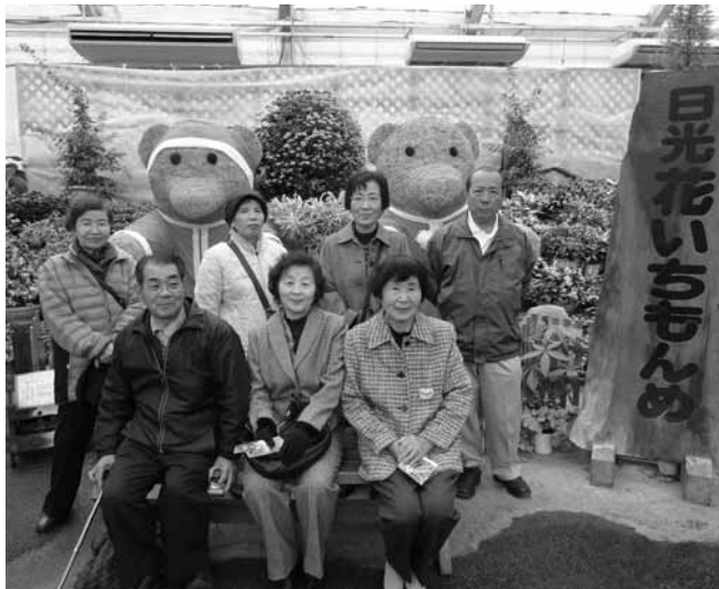
日光花いちもんめにて