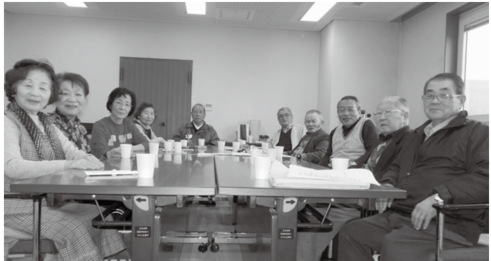
2月24日(火) 茶話会にて