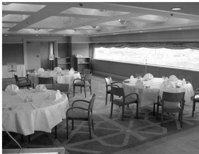
眺めのいいローズルーム