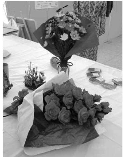
～ 出展された作品の一部 ～