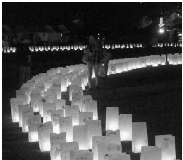
夜のルミナリエ（夜も頑張って歩きました）