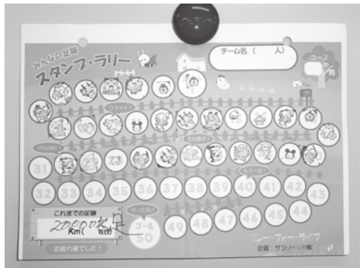
スタンプラリーの用紙 20000歩 歩きました！