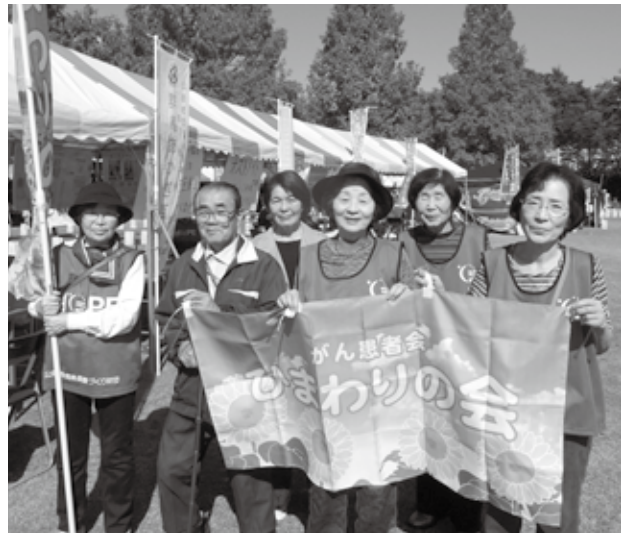
サバイバースラップ