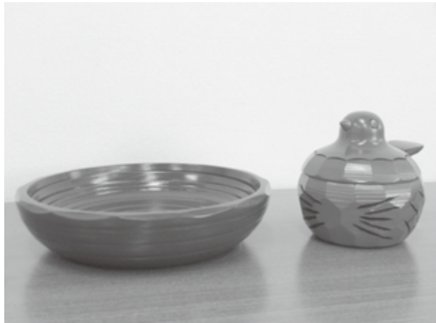
表彰状と共に頂いた記念品