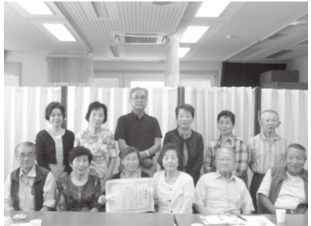
6月の定例会で会員の皆さんと