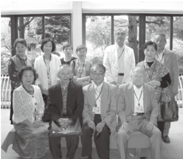
ホテル「清風園」にて