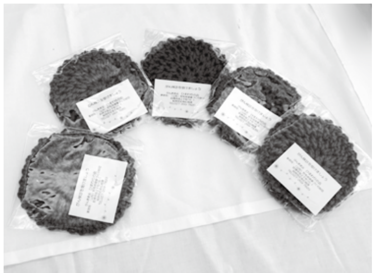
紫色のコースター (がん検診の啓発メッセージ入り)