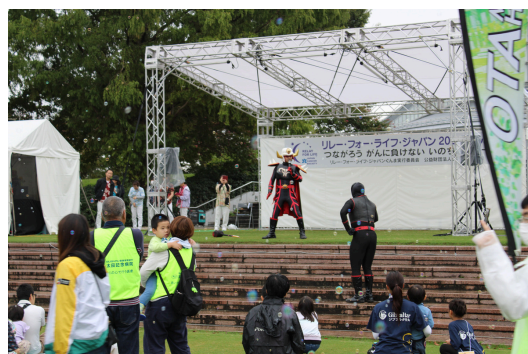
ステージイベント