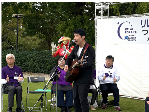
知事からの歌の応援