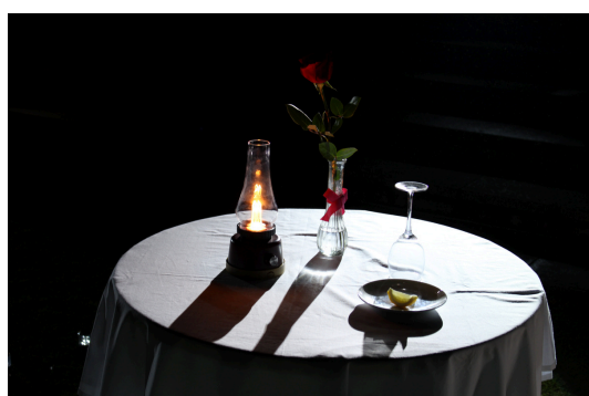
エンプティテーブルセレモニー