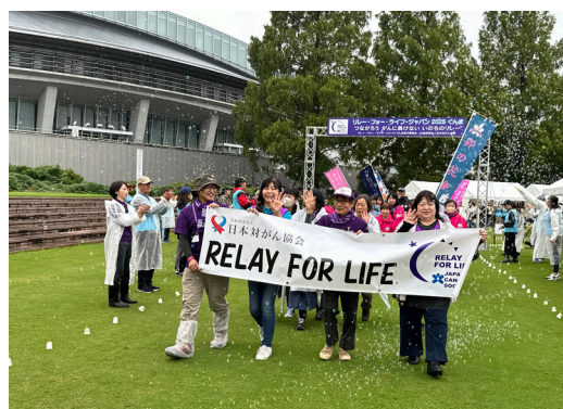
サバイバースウォーク