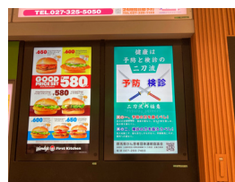
◀高崎駅に掲出したデジタルサイネージ