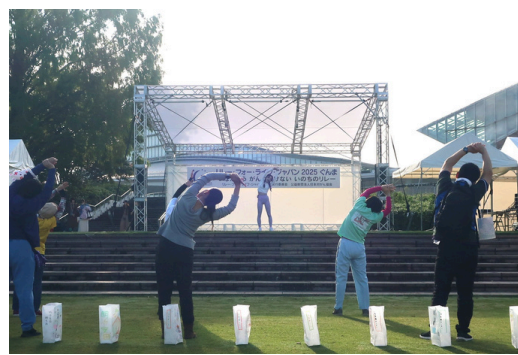
ドクター講座（モーニングヨガ）

写真データを御希望の方は事務局までご連絡ください！ メール等でお送りさせていただきます。